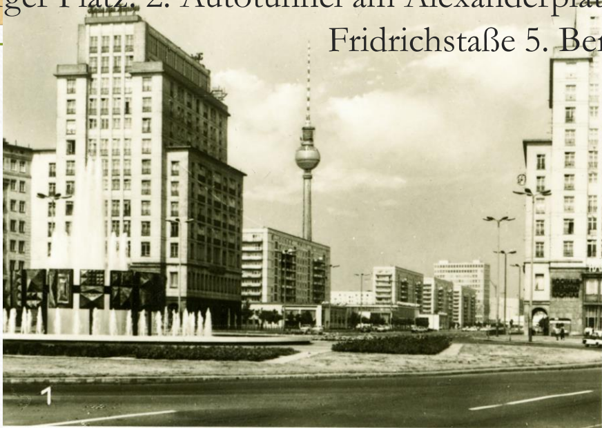
1. Strausberger Platz. 2. Autotunnel am Alexanderplatz. 3. Bahnhof Alexanderplatz. 4. Blick zum Bahnhof Fridrichstraße 5. Berliner Fernsehturm.