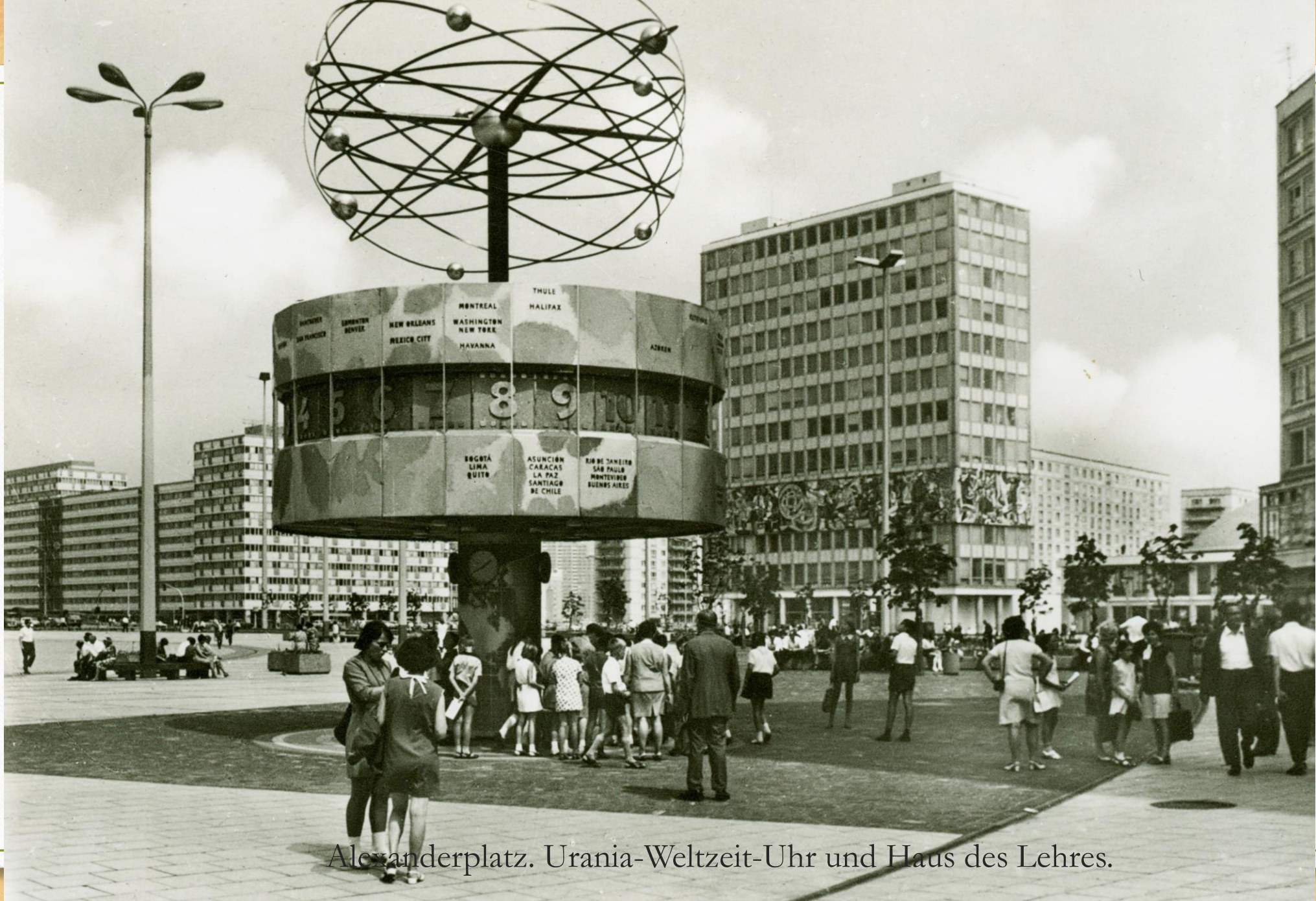
Alexanderplatz. Urania-Weltzeit-Uhr und Haus des Lehres.