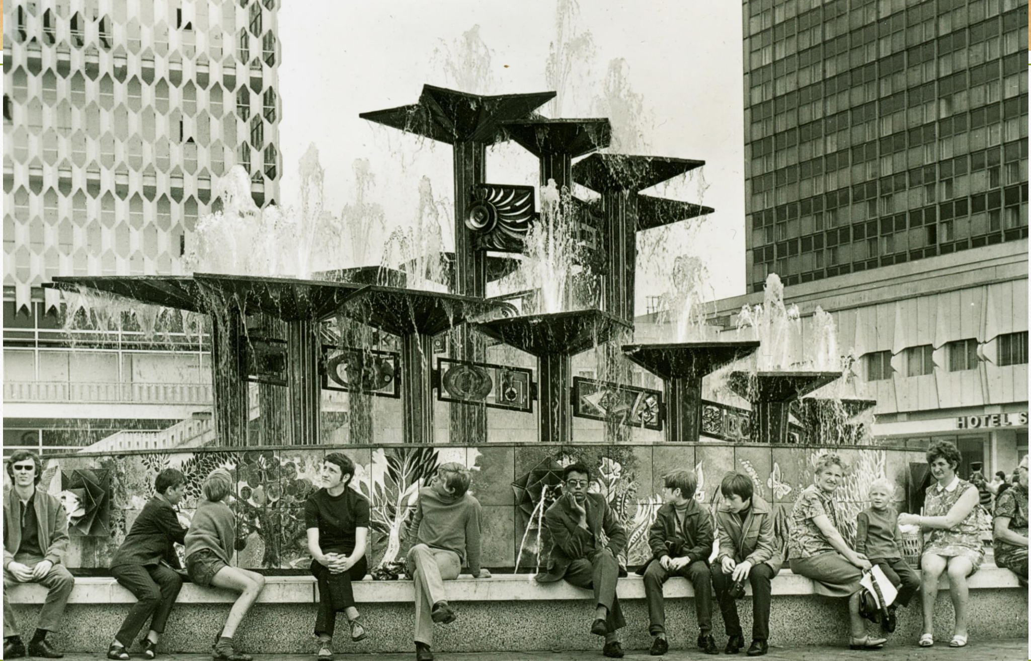
Brunnen am Alexanderplatz