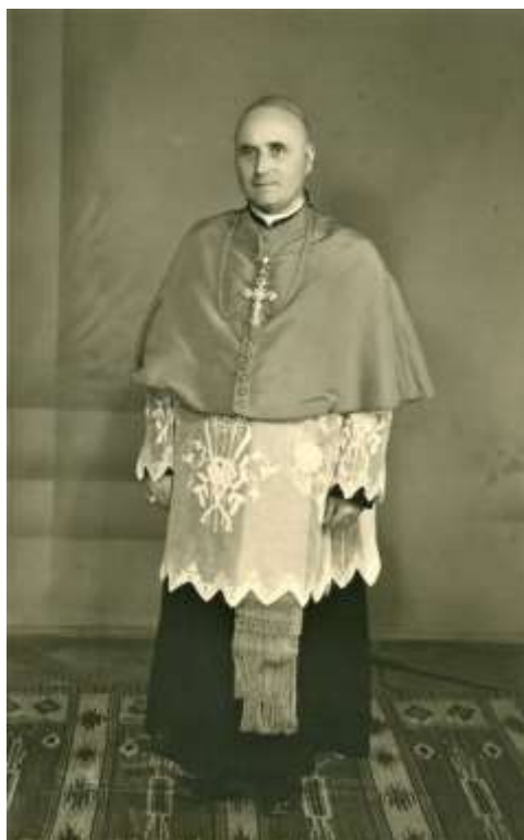
Zdjęcie 5 – Rok 1949. Biskup lubelski Piotr Kałwa. Zdjęcie z kroniki parafii Grabowiec.