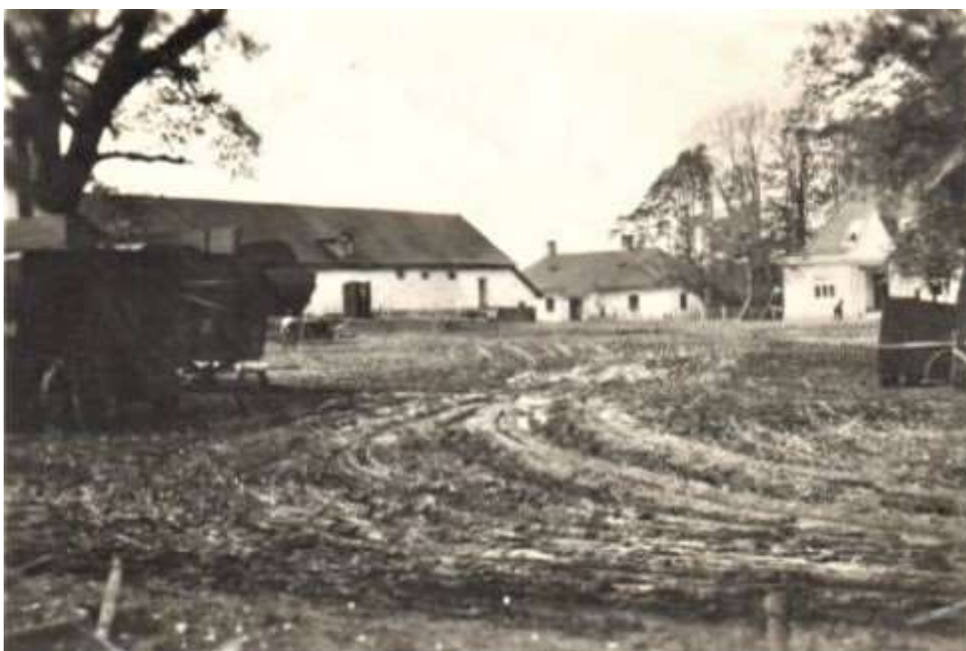
Zdjęcie 10 – Rok 1944. Siedlisko. Zabudowania dworskie. Po lewej stronie widoczna jest młocarnia szerokomłotna. Po lewej stronie widoczna jest obora z chlewnią, w środku wozownia (dwa kominy), po prawej stronie widoczny jest fragment dworu. Opis zdjęcia Ryszard Karczmarczuk.