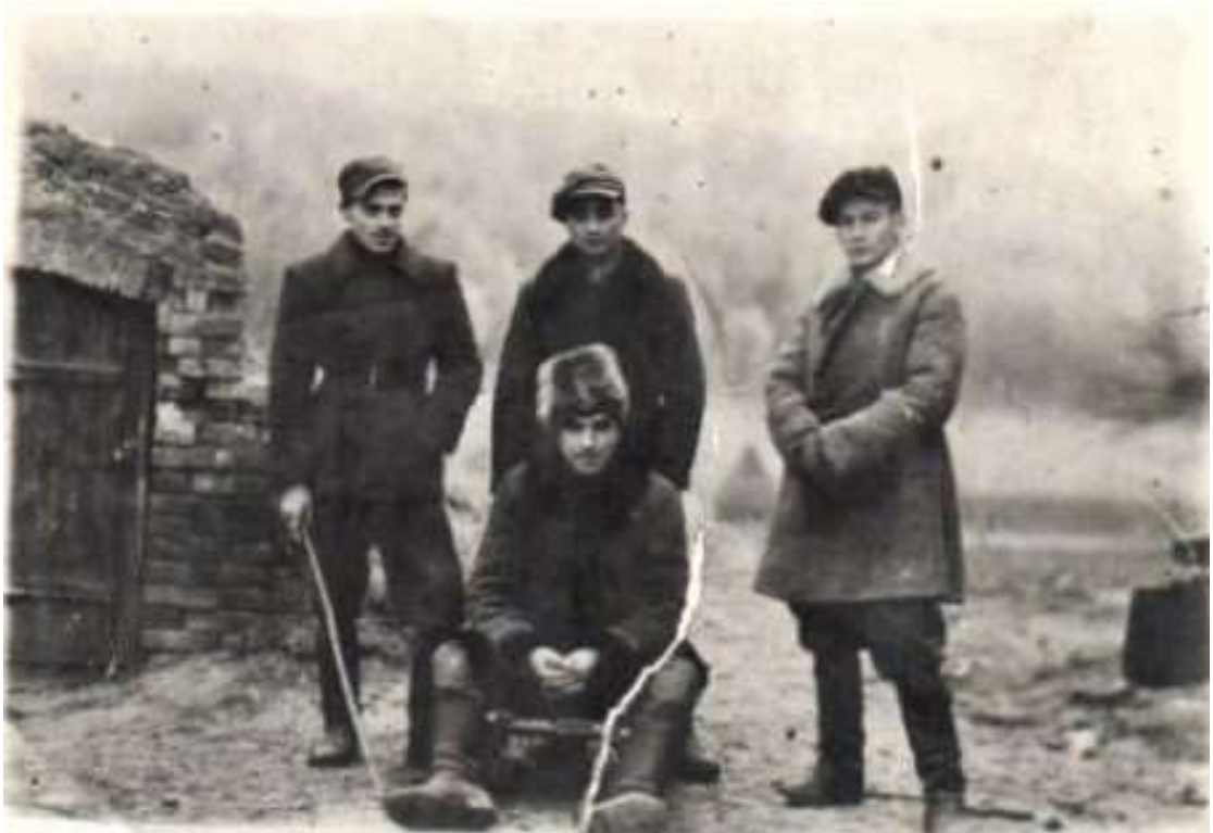
Zdjęcie 15 – Rok 1944, 7 października (lub w dniach następnych). Czteroosobowa grupa żołnierzy AK po odbiciu więźniów z więzienia w Zamościu.