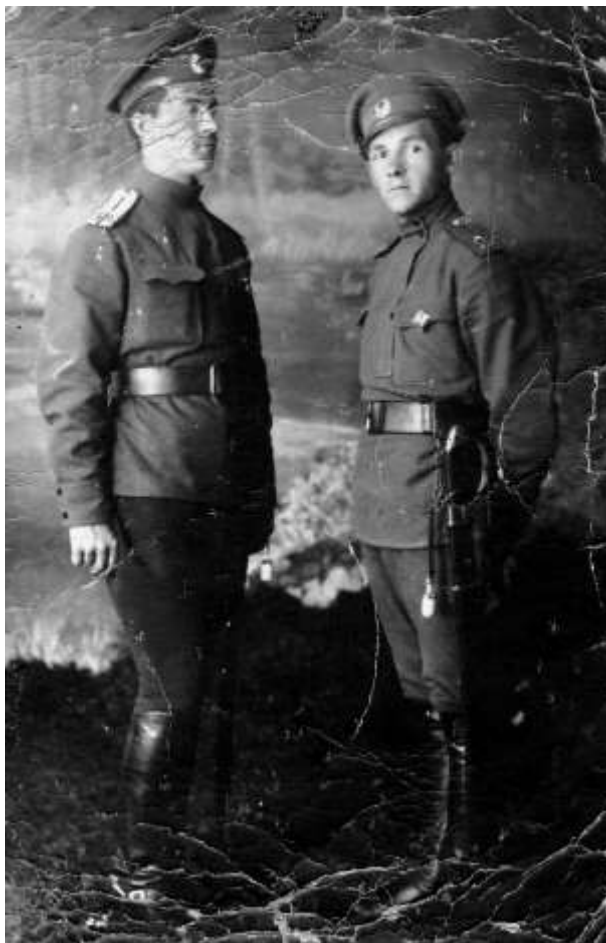
Zdjęcie 14 – Rok 1916. Moskwa. Z dedykacją dla brata i Ani.