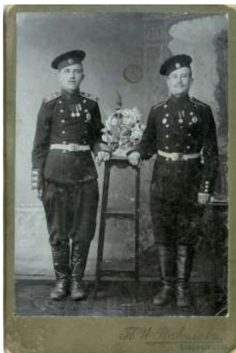
Zdjęcie 8 – Rok 1915 (około). Polacy (z Grabowca) w armii carskiej.