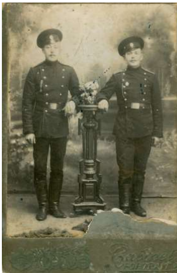
Zdjęcie 7 – Rok 1915 (około). Polacy (z Grabowca) w armii carskiej.