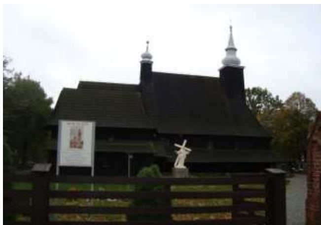
Zdjęcie 6 – Rok 2017, 8 października. Kościół św. Anny, z 1518 roku, filialny parafii Bożego Ciała w Oleśnie.