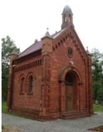
Zdjęcie 8 – Rok 2017, 8 października. Kaplica na cmentarzu przykościelnym św. Anny w Oleśnie.

Kaplicę wybudował w 1880 roku baron Johann Gottlib von Reiwitz, właściciel majątku Wędrynia, w dowód wdzięczności za uzdrowienie syna (...). W Wędryniu, obo dawnego dworu, jest malutki cmentarz.