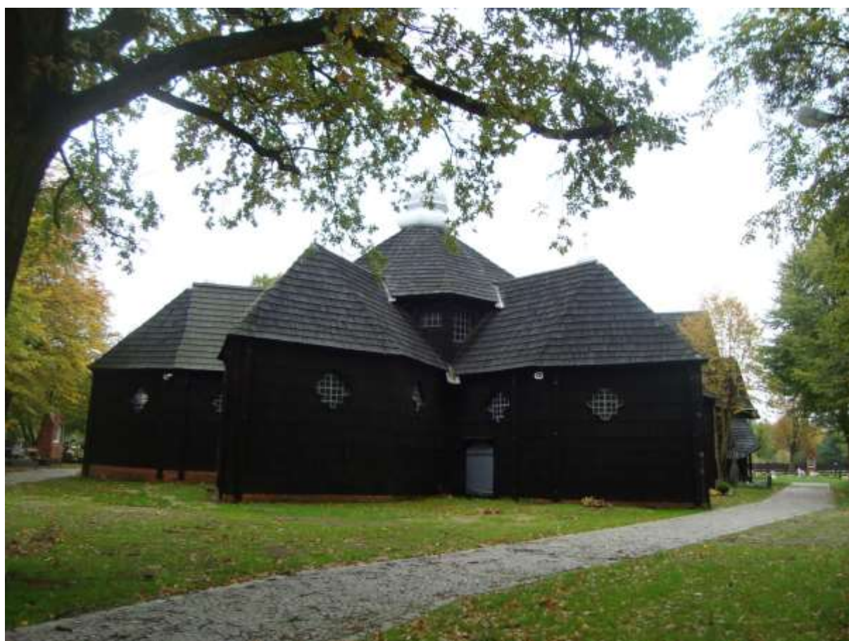
Zdjęcie 7 – Rok 2017, 8 października. Kościół św. Anny, z 1518 roku, filialny parafii Bożego Ciała w Oleśnie.