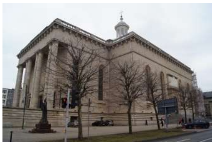
Zdjęcie 4 – Rok 2018, 1 kwietnia. Archikatedra Chrystusa Króla w Katowicach.