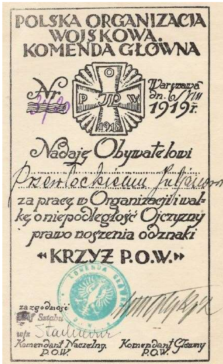
Dokument 4 – Rok 1919, 6 sierpnia. Dyplom nadania odznaki „Krzyż P.O.W.” za pracę w Polskiej Organizacji Wojskowej i za walkę o niepodległość ojczyzny (dokument ze zbiorów Ryszarda Karczmarczuka).